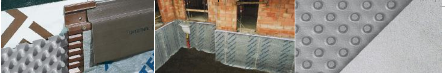
DELTA®-MS PROFİL, DELTA®-GEO DRAIN CLİP ile birlikte. Kalıcı filtrasyon drenajı.