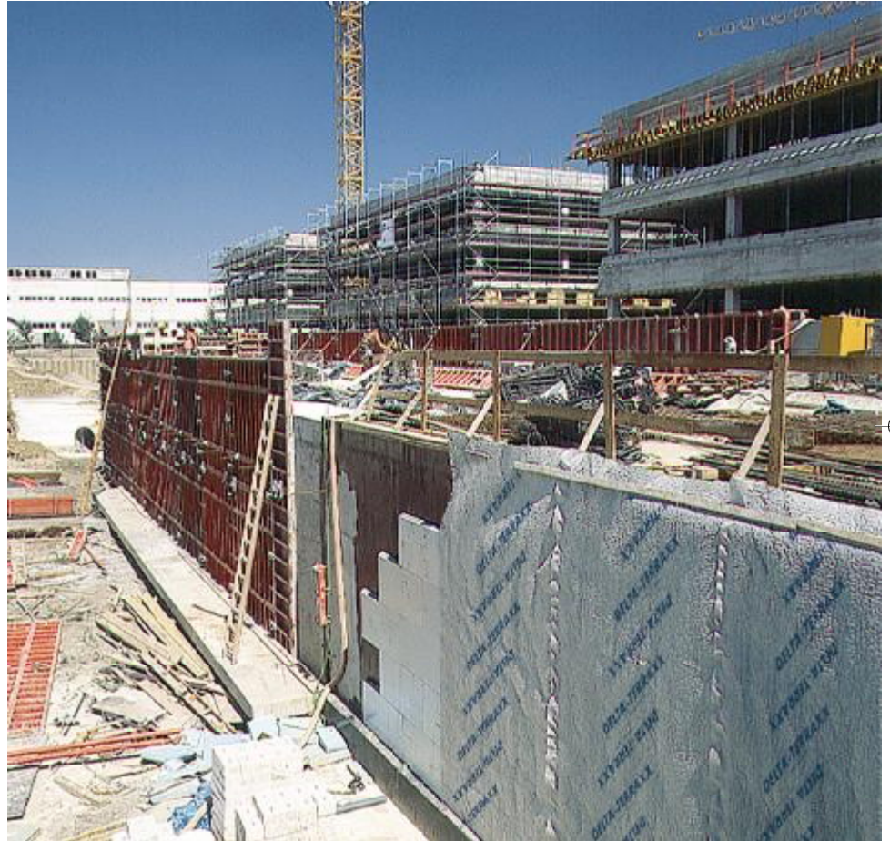
DELTA®-TERRAXX perimetrik izolasyon üzerinde maksimum güvenlik sağlar.